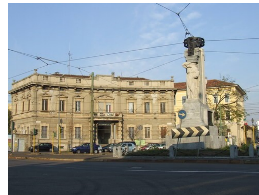
La palazzina ex Comune di Musocco prossima sede del Cscs