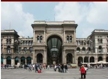
Milano, Galleria Vittorio Emanuele II—sede CSCS

Foglio notizie del Centro Sociale Culturale Sardo