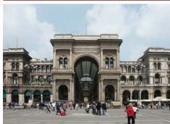
Milano, Galleria Vittorio Emanuele II—sede CSCS

Foglio notizie del Centro Sociale Culturale Sardo Via Ugo Foscolo, 3—20121 Milano