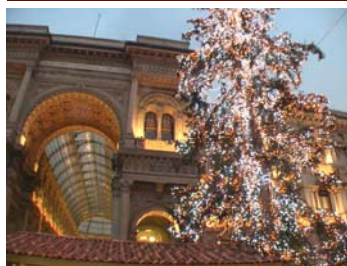
Milano, Galleria Vittorio Emanuele II—sede CSCS

Foglio notizie del Centro Sociale Culturale Sardo Via Ugo Foscolo, 3—20121 Milano tel 02 8690220—fax 02 72023563— E-mail : cscs.milano@libero.it www.centrosocialeculturalesardo.it