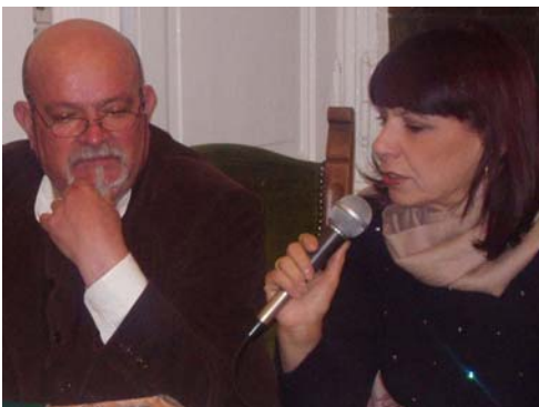
Salvatore Niffoi nell'incontro al CSCS

Il messaggio che mi ha mandato Salvatore Niffoi, vincitore della 44esima edizione del premio Campiello lo scorso 11 Settembre a Venezia con il romanzo "La Vedova Scalza" ediz. Adelphi, in risposta alle congratulazioni inviate a nome di tutti i soci del Centro: