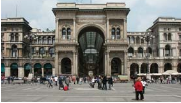
Milano, Galleria Vittorio Emanuele II—sede CSCS