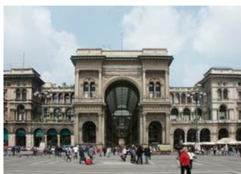
Milano, Galleria Vittorio Emanuele II—sede CSCS

Foglio notizie del Centro Sociale Culturale Sardo Via Ugo Foscolo, 3—20121 Milano